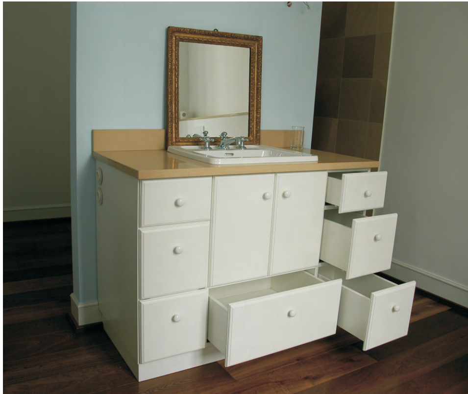
Waschtisch - Schrank weiß lackiert mit Griffkugeln aus Keramik