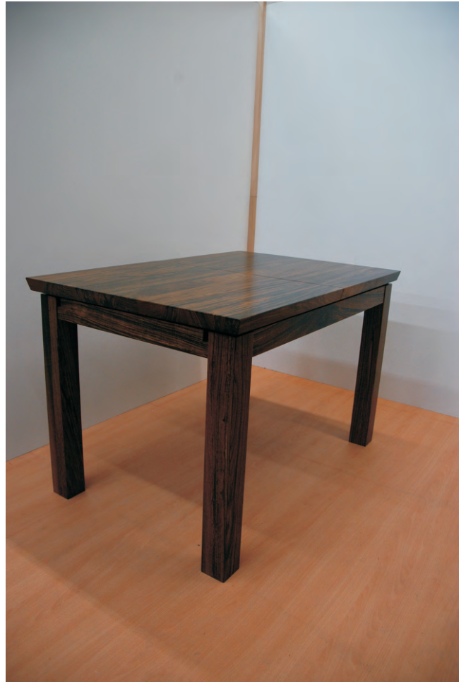
Esstisch ausziehbar aus Ovangkol massiv