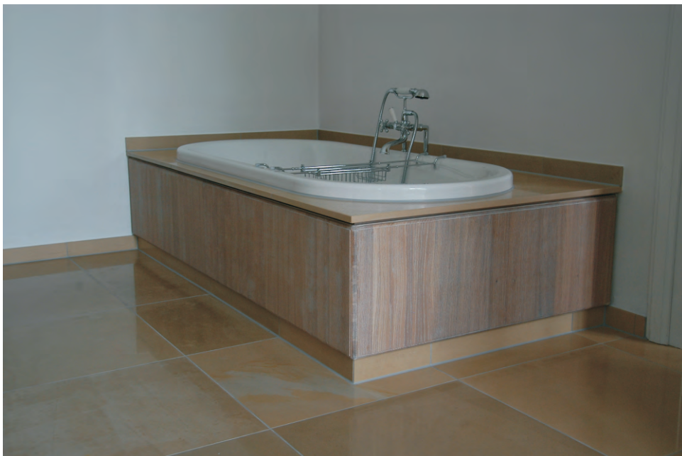
Badewannen - Einfassung aus Eiche