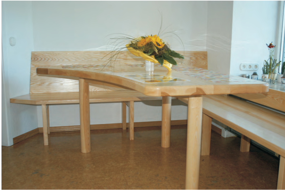
Sitzgarnitur in Esche massiv