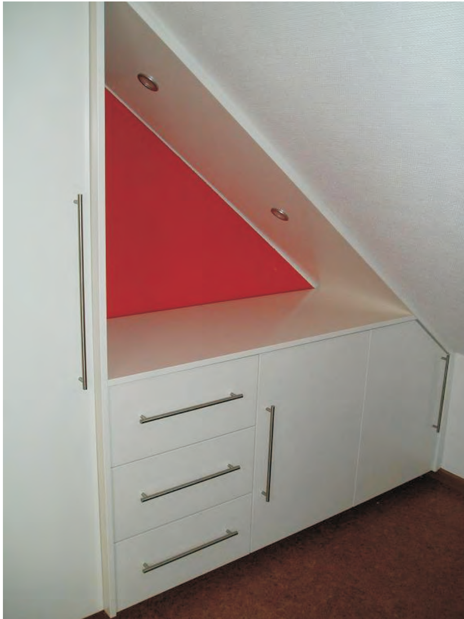
Einbauschränk mit Beleuchtung unter einer Dachschrägen