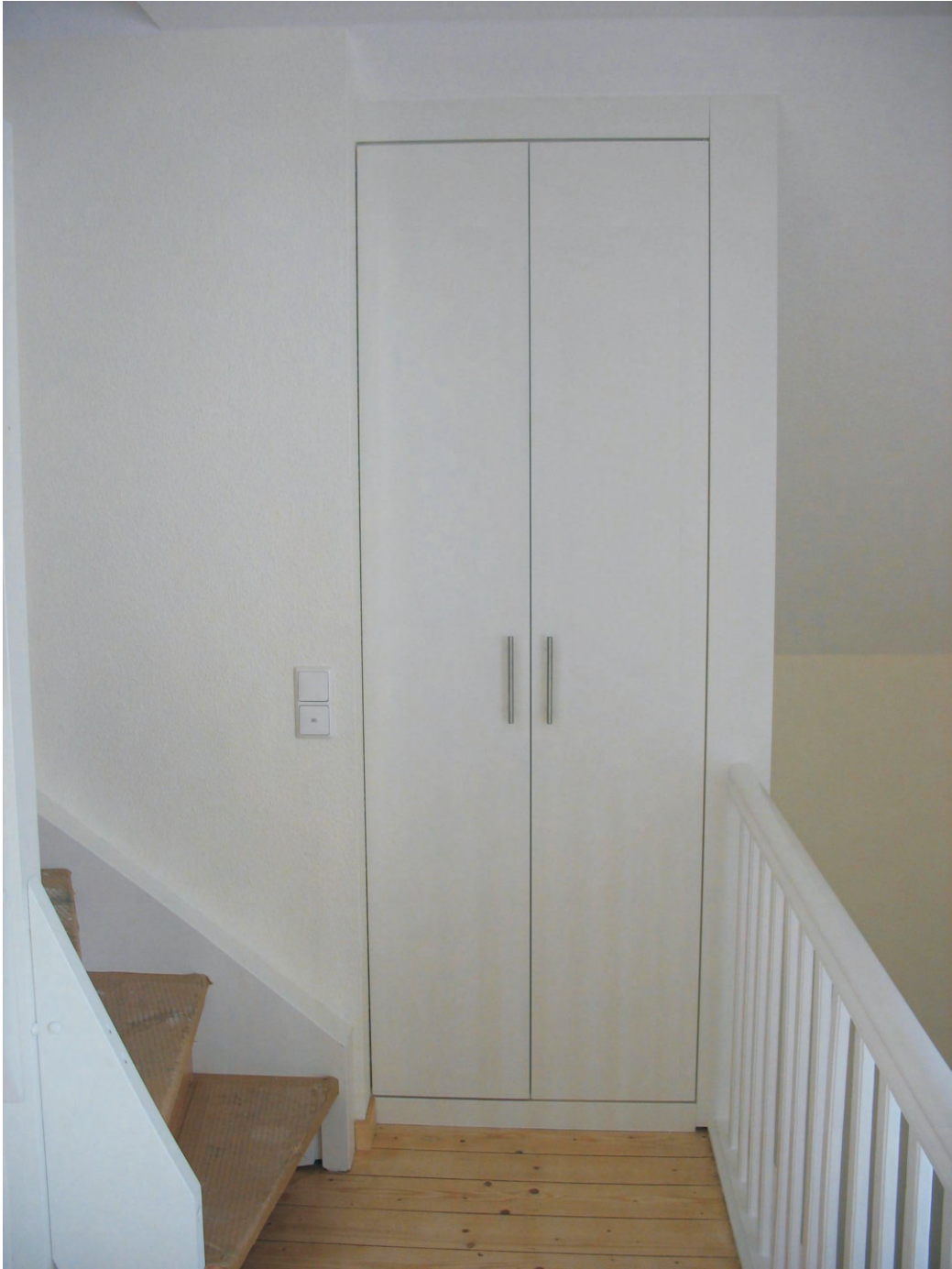
Einbauschränk in einem Treppenhaus