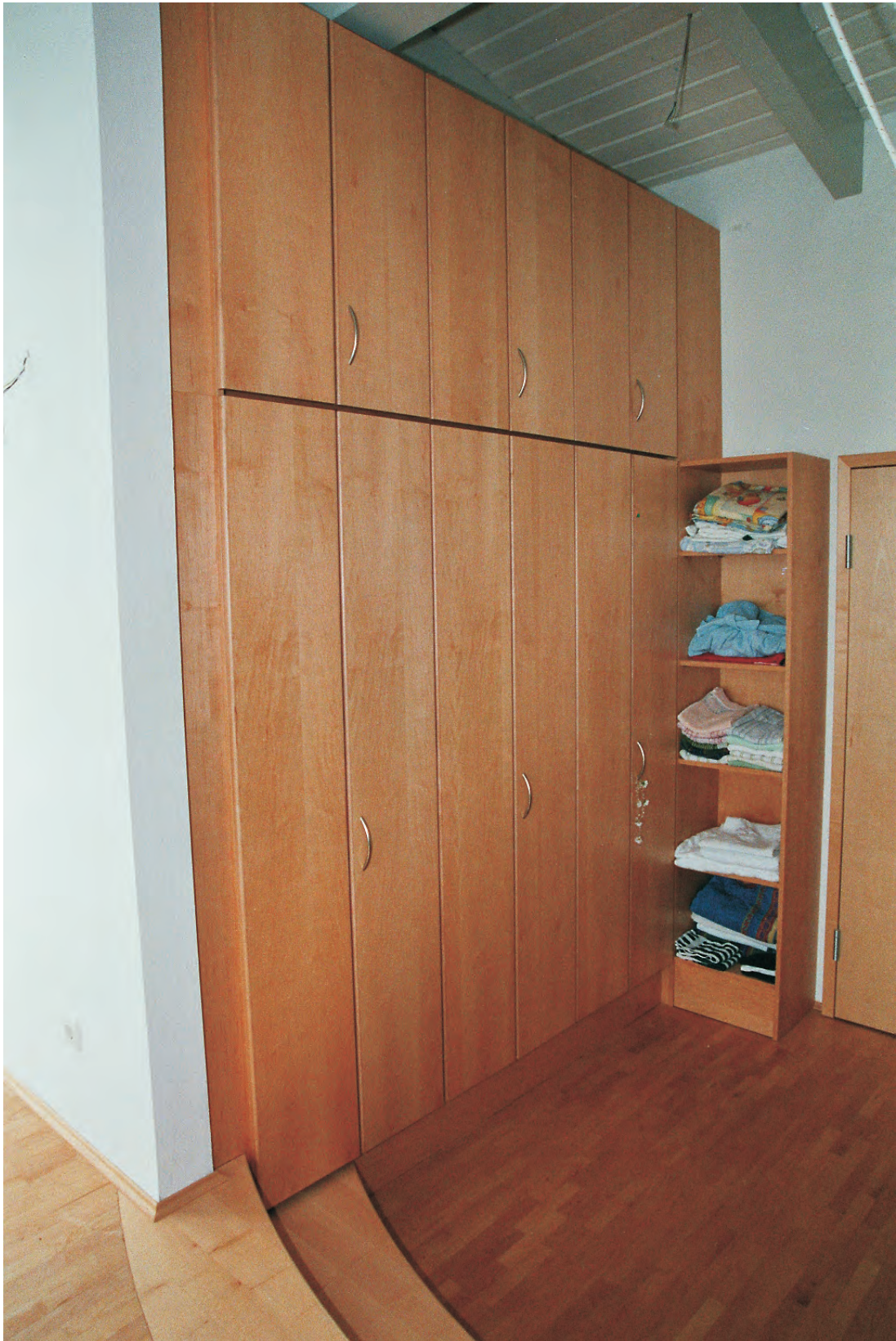
Einbauschränk in kanad. Ahorn