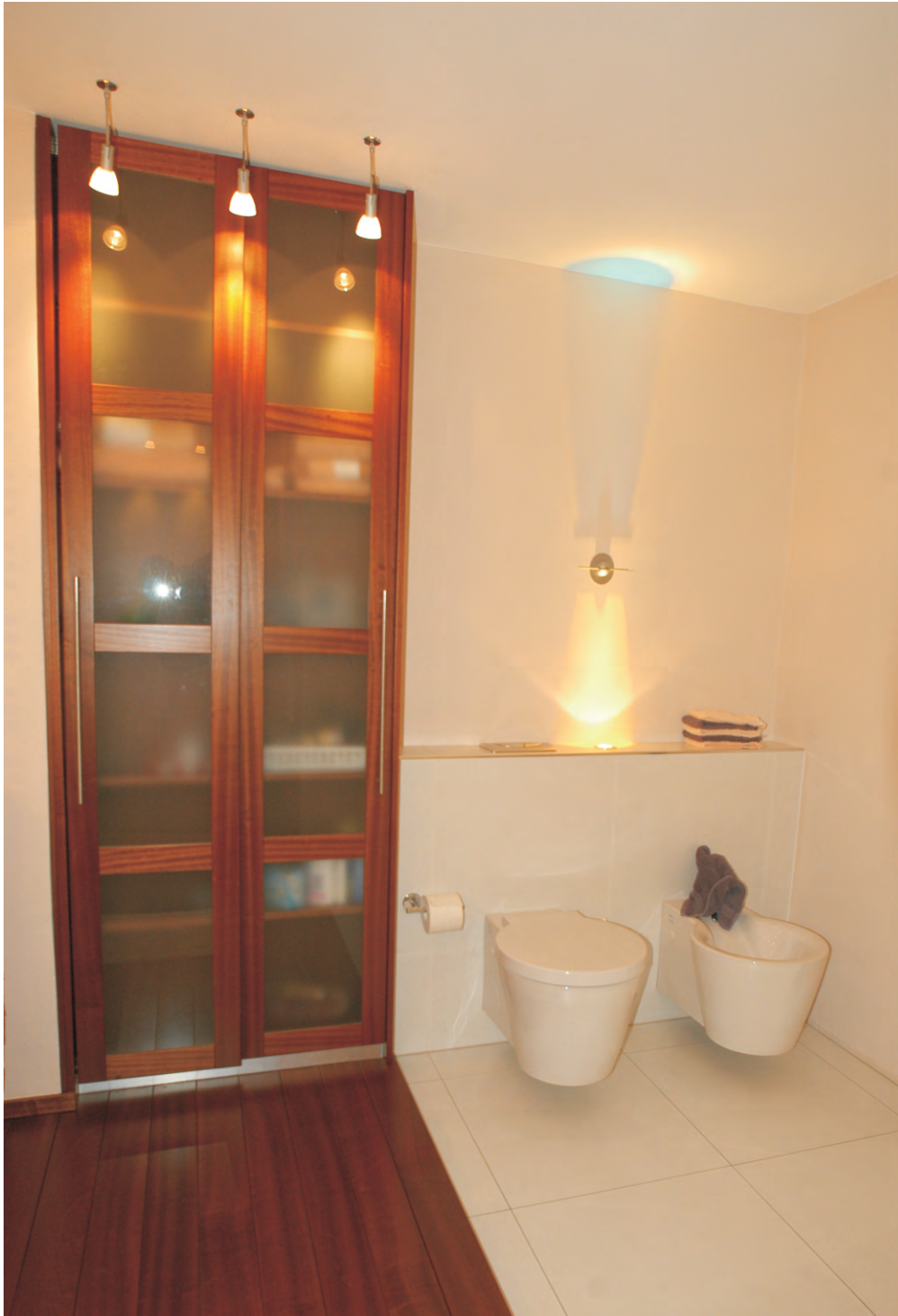
Komplettausbau eines Badezimmers in Mahagoni