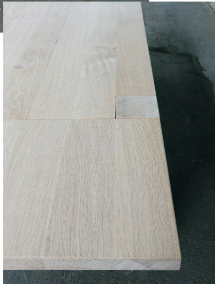
Ausziehbarer Esstisch aus Eiche massiv