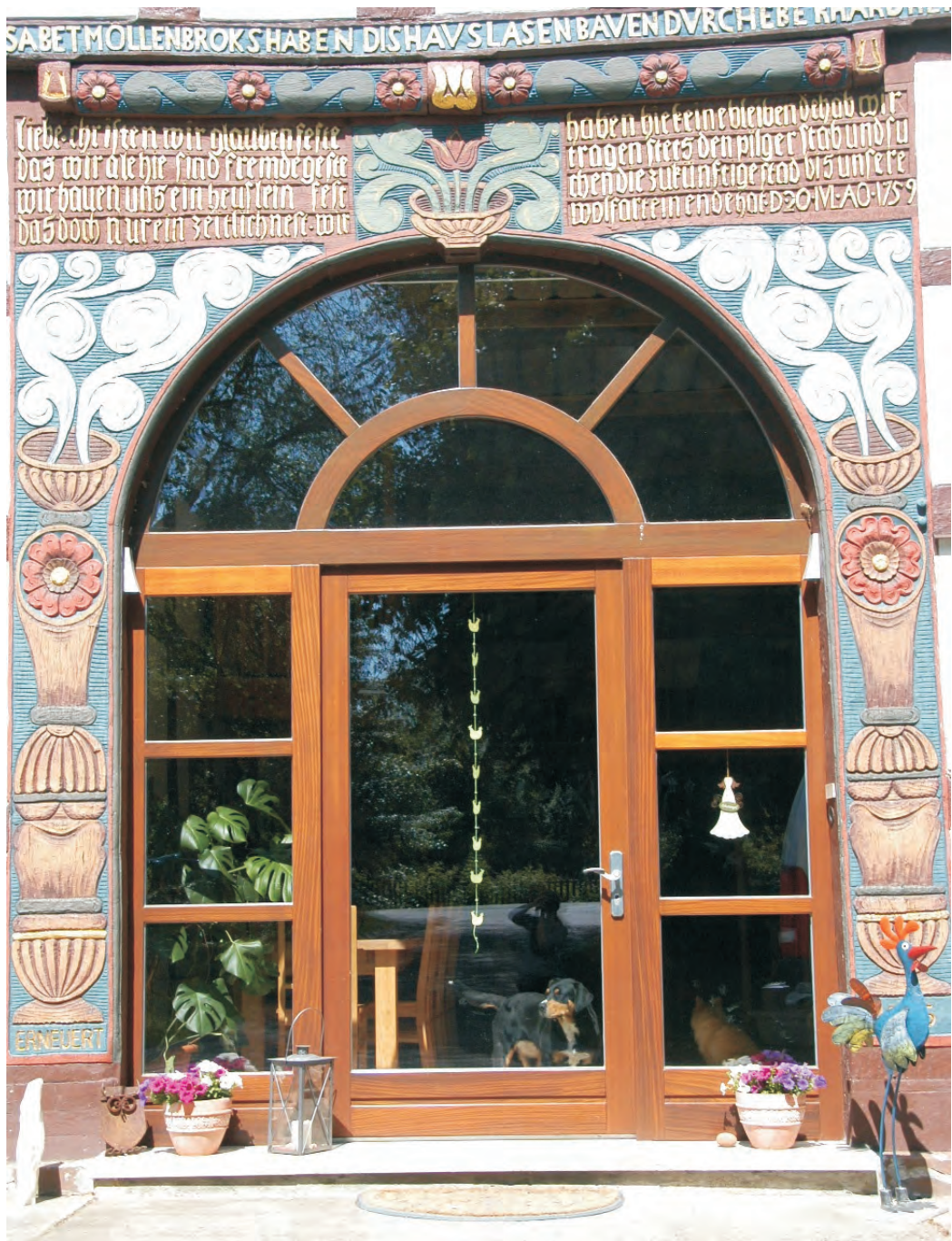
Dieltor nach Maß in Mahagoni