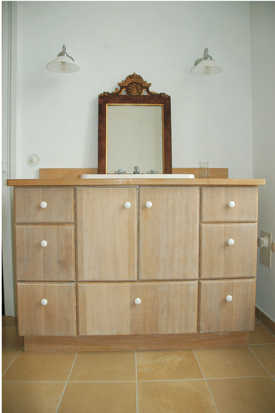
Waschtisch - Schrank aus Eiche weiss gekälkt mit Griffkugeln aus Keramik