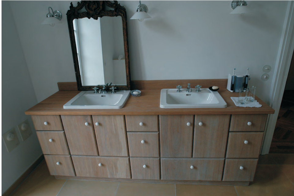
Waschtisch - Schrank aus Eiche mit Griffkugeln aus Keramik